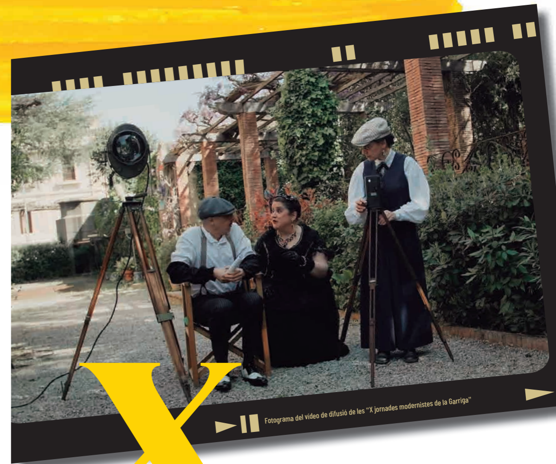
Fotograma del vídeo de difusió de les "X jornades modernistes de la Garriga"